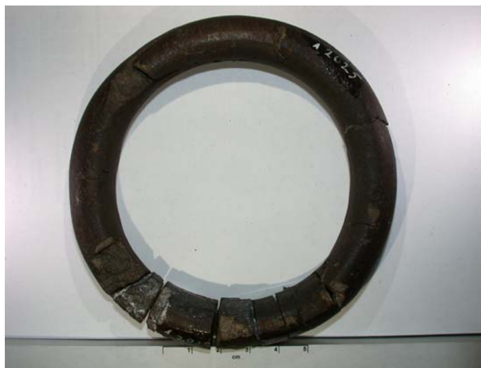
Náramek z doby železné, ČR

která se uskuteční v úterý 9. prosince 2008 od 16:00 na Geologickém pavilonu v areálu Vysoké školy báňské - TU Ostrava