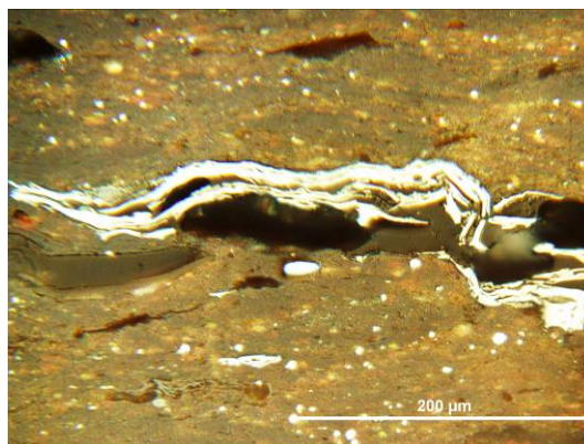
Základní suroviny černých šperků sapropelového typu

informace sledujte na: http://geologie.vsb.cz/loziska v sekci Události